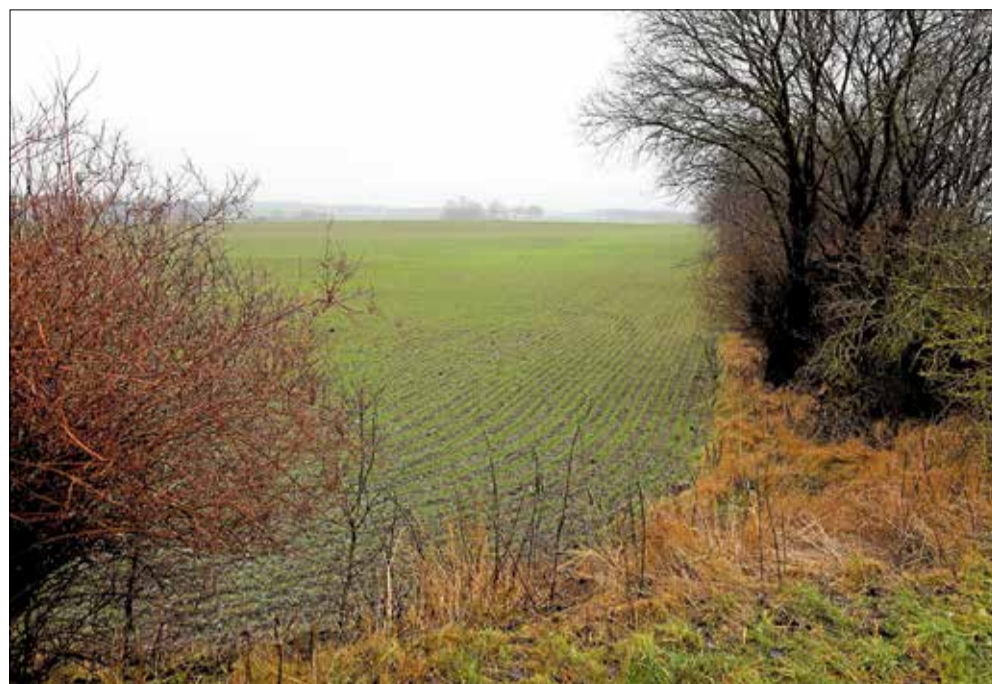
Det åbne land med marker, hegn og vådområder mellem Lyngby, Hillerød og Gørlose.